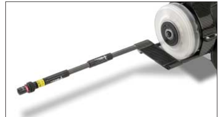
IBAK PANORAMO 3D Kugelbildscanner mit IBAK Laser Profiler