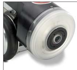
IBAK PANORAMO 3D Kugelbildscanner Objektiv und Xenon Blitzbeleuchtung

An einem „PANORAMO - System“ können auf Wunsch weitere IBAK TV Kameras betrieben werden.