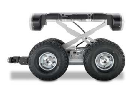
IBAK PANORAMO 3D Kugelbildscanner mit Luftreifen und Höhenverstellung